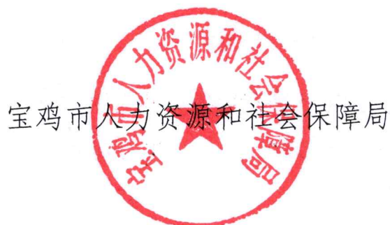
宝鸡市人力资源和社会保障局