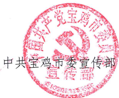
中共宝鸡市委 宣传部